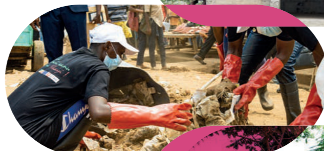
Collecter, traiter et valoriser les déchets ménagers