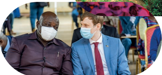
Appuyer les mairies dans leur développement urbain

LES PREMIÈRES ÉTAPES ● Juin 2021 ● Août 2021 ● Novembre 2021 ● Premier trimestre 2022 ● Second semestre 2022