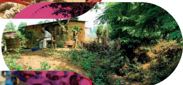
Lutter contre l'érosion des sols et les inondations