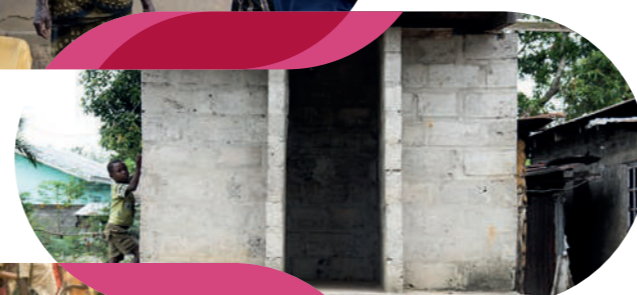
Proposer des équipements sanitaires modernes