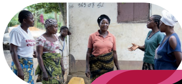
Mettre les citoyens au cœur de l'action municipale